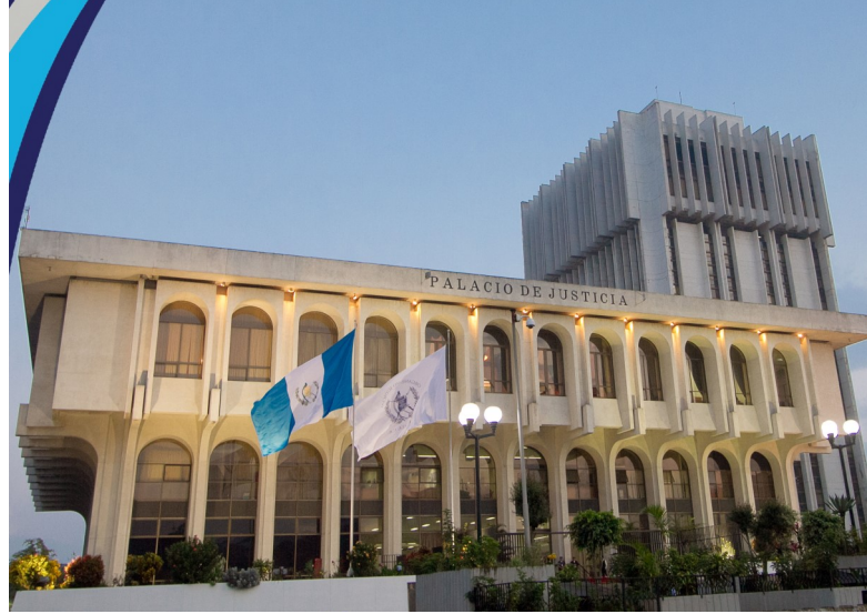
Foto: Palacio de Justicia y Torre de Tribunales, Ciudad de Guatemala.