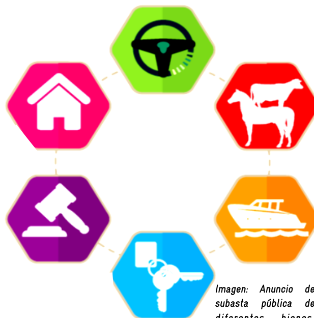
Imagen: Anuncio de subasta pública de diferentes bienes.