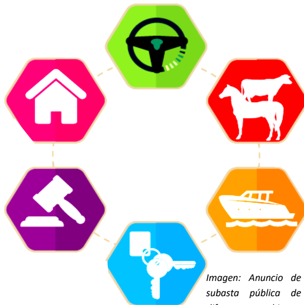
Imagen: Anuncio de subasta pública de diferentes bienes.