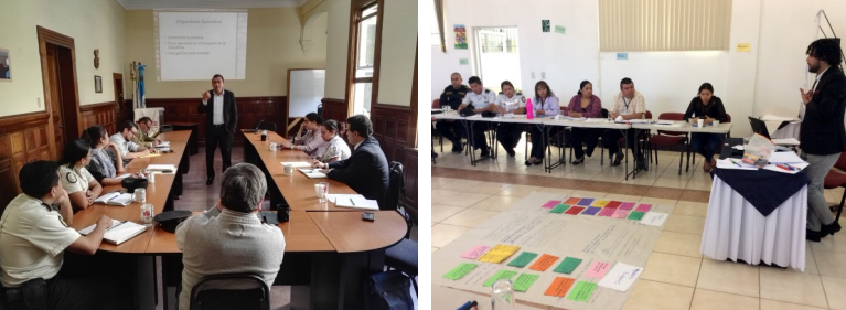
Fotos: Formación y reuniones de trabajo.