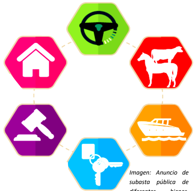
Imagen: Anuncio de subasta pública de diferentes bienes.