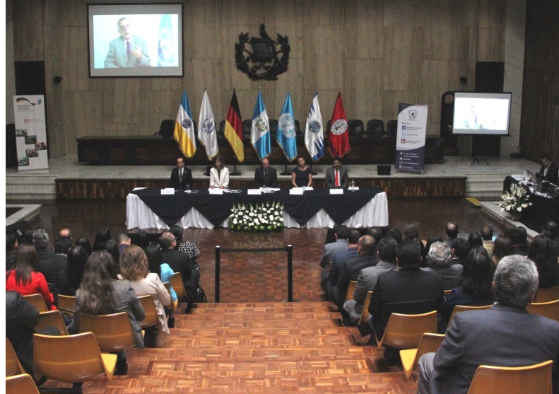
Fotos: Presentación de hallazgos y recomendaciones de la 1ra Fase del Observatorio