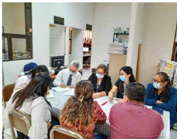
Grupo focal para el diagnóstico situacional del Juzgado Tercero Pluripersonal de Ejecución Penal de Chiquimula.