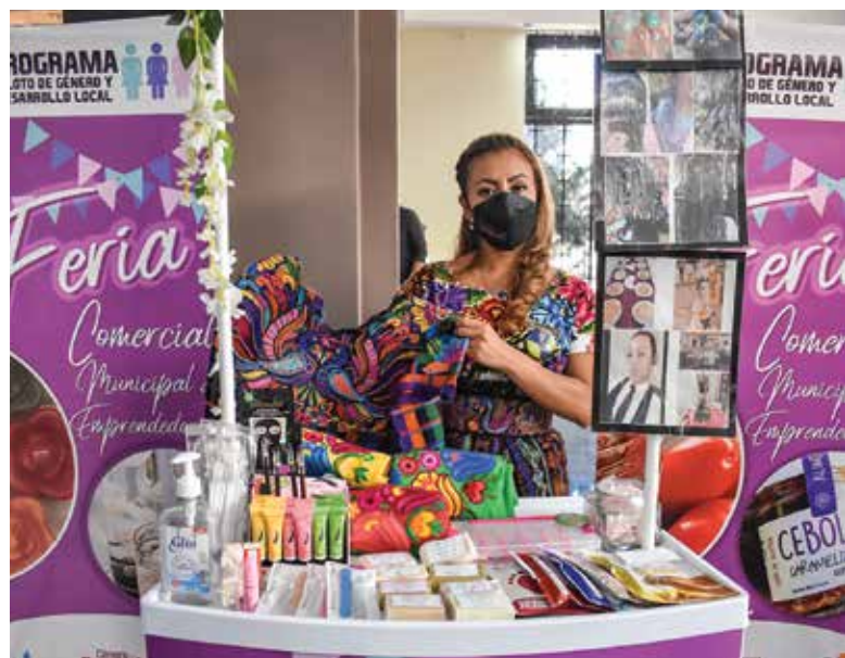
Feria comercial de la Municipalidad de Guatemala Fotografía: CCG.

Se desarrolló una primera metodología, enfocada en atención empresarial, que se institucionalizó en el equipo de la CCG y en diez municipalidades del país, fortaleciendo así las capacidades de 50 integrantes de sus equipos técnicos. Se formó a diez grupos de mujeres emprendedoras en cada municipalidad, llegando a un total de más de 300 beneficiarias. Se logró la vinculación comercial de 200 emprendimientos liderados por mujeres.