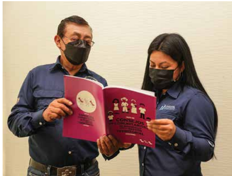
Promotores sociales revisan los materiales producidos en el marco del proyecto.