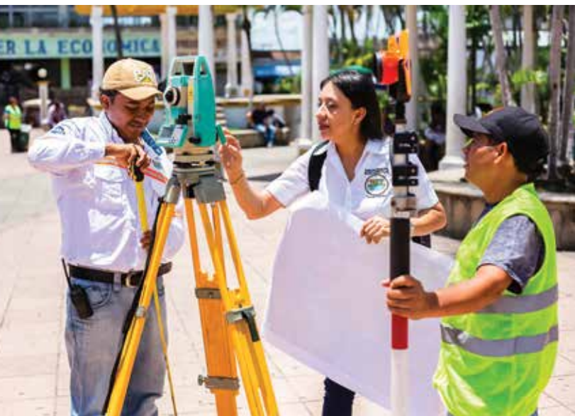
Personal de la Municipalidad de Escuintla realizando mediciones para el POT.