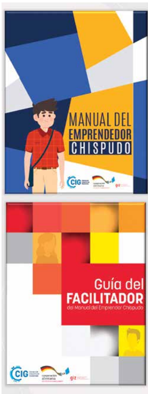
Portadas de los manuales del emprendedor chispudo

“La metodología del Emprendedor Chispudo se sigue utilizando. Ahora la implementamos en alianza con el Ministerio de Economía y la Organización Internacional para las Migraciones para seguir capacitando en Quiché, Huehuetenango, San Marcos y Quetzaltenango.”