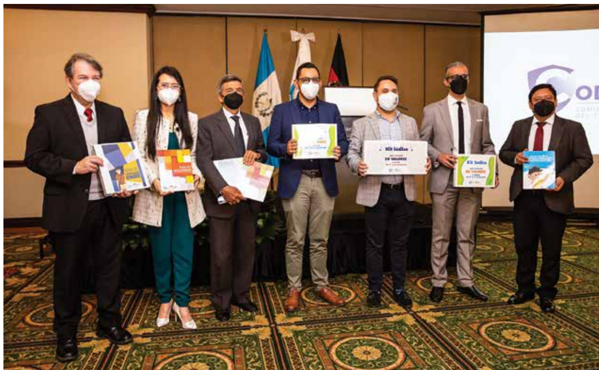
Evento de cierre del proyecto. Autoridades, consultores y personal de GIZ muestran algunas de las herramientas desarrolladas.