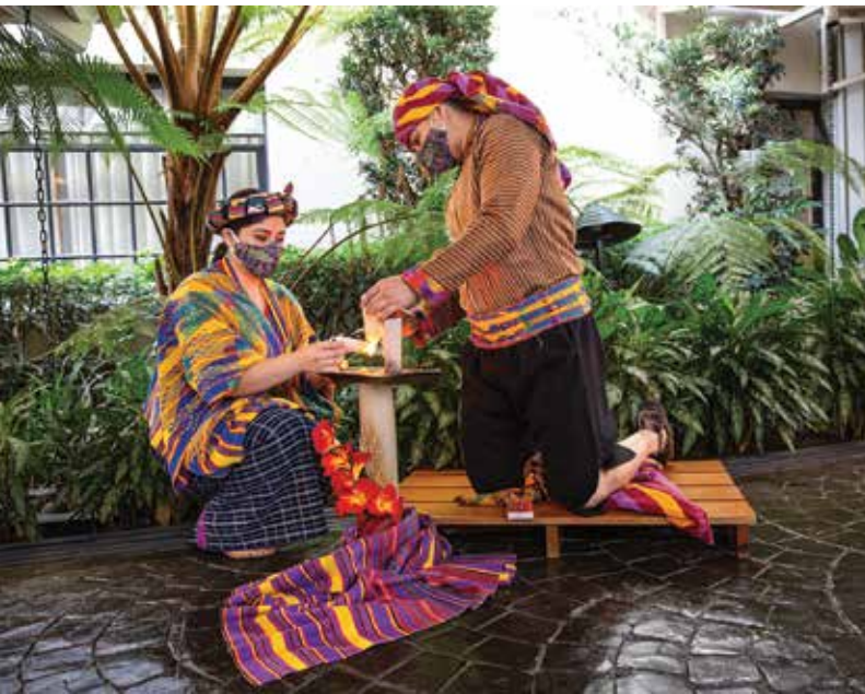
La riqueza cultural es uno de los principales atractivos turísticos del país.

Se espera que, con la asesoría brindada, el servicio de inspección de servicios turísticos del INGUAT sea reconocido y otorgue mayor confianza, elevando la calidad de los servicios, fortaleciendo la imagen de país y que el sector turístico contribuya de forma sostenible a la reactivación económica post COVID-19. Además, se desea que otras partes interesadas se involucren en el despliegue de la infraestructura de la calidad, a través de la creación de normas técnicas y la acreditación de organismos, entre otros.