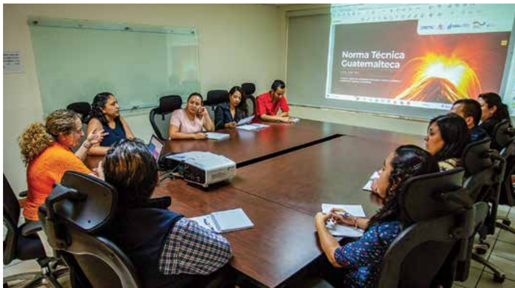
Reunión de trabajo para la formulación de NGT.

En el marco de su despliegue, la DSNC junto con el INGUAT identificaron la necesidad de asistencia técnica para que la Oficina Guatemalteca de Acreditación (OGA) y la Unidad de Calidad y Sostenibilidad Turística (UCST) desarrollaran e implementaran el esquema de inspección de servicios turísticos, con el objeto de acreditar a la UCST conforme la Norma Técnica Guatemalteca (NGT) de la Comisión Guatemalteca de Normas (COGUANOR) ISO/IEC 17020 para tener un aval nacional e internacional al contar con un Organismo de Inspección acreditado.