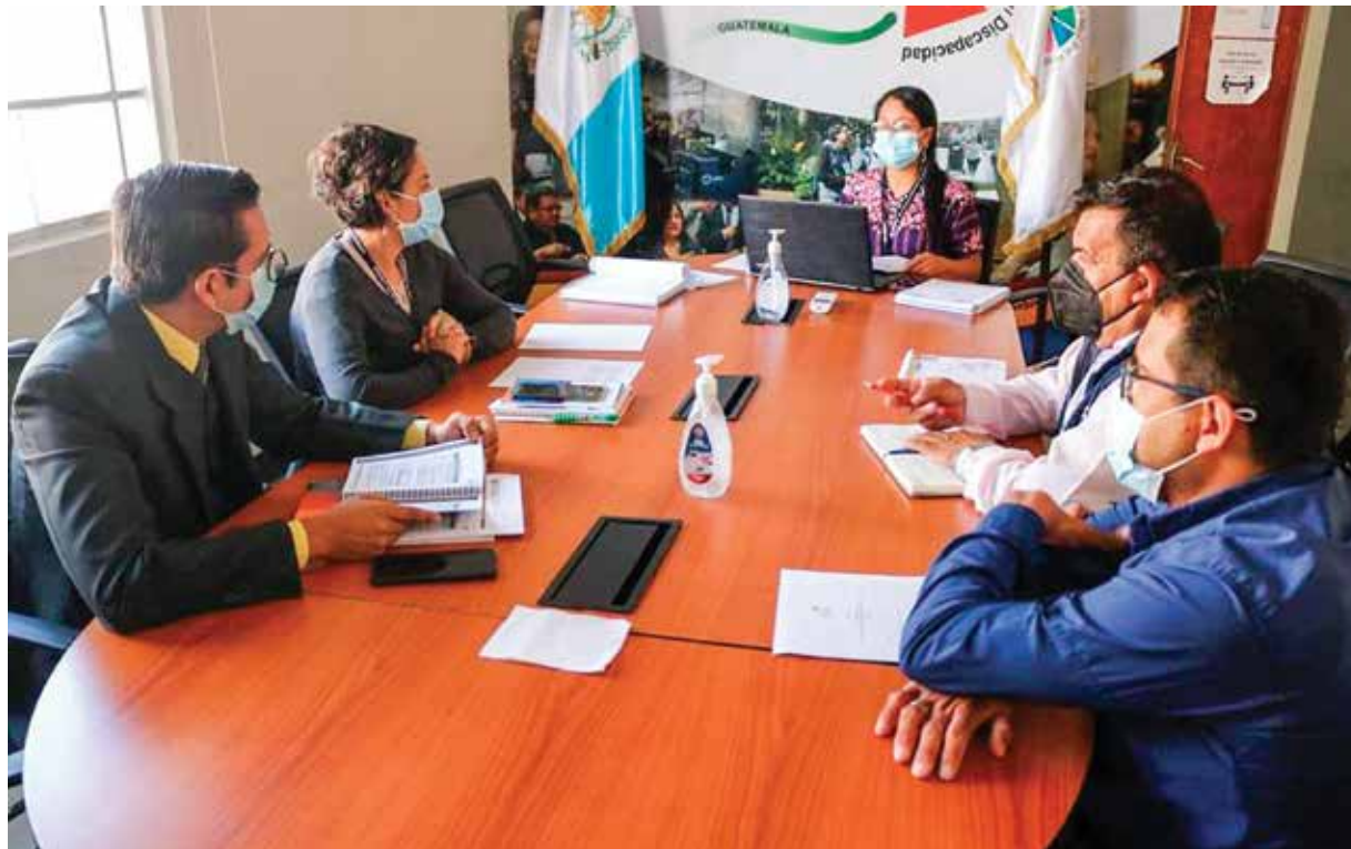
Julio 2021, COPADEH y CONADI coordinan acciones para elaborar informe sobre derechos humanos.

“Quisiéramos vincular el SIMOREG con las Prioridades Nacionales de Desarrollo y con la Política General de Gobierno e integrar recomendaciones y sentencias del Sistema Interamericano de Derechos Humanos. Otro tema en el que ya estamos trabajando es mejorar la seguridad informática del sistema, para que podamos brindar acceso público a consulta a las personas interesadas en el cumplimiento del Estado en materia de Derechos Humanos.”