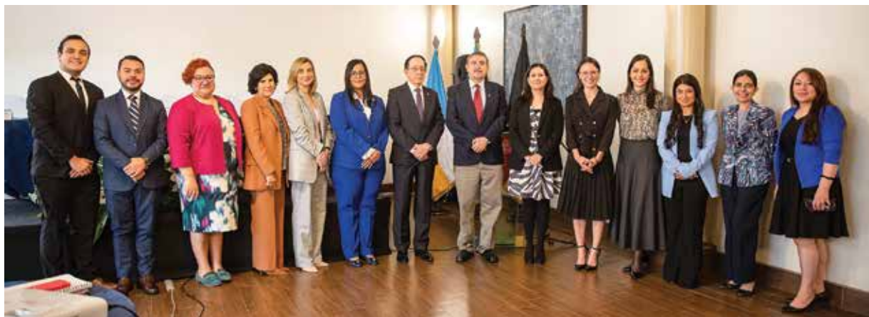
Evento de cierre del proyecto, en el que participaron autoridades y personal de URL, USAC y GIZ, así como estudiantes de ambas universidades.