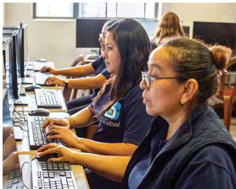
Nuevo laboratorio para Junkacentro.

También el curso de manejo de redes experimentó una reestructuración completa, enfocándose en un programa basado en proyectos, adicionalmente se propusieron tres nuevos cursos según la demanda laboral, siendo diseño de páginas web, desarrollo de aplicaciones móviles y creación de videos para redes sociales. Se recibió apoyo para la implementación de un nuevo laboratorio con los requisitos técnicos necesarios.