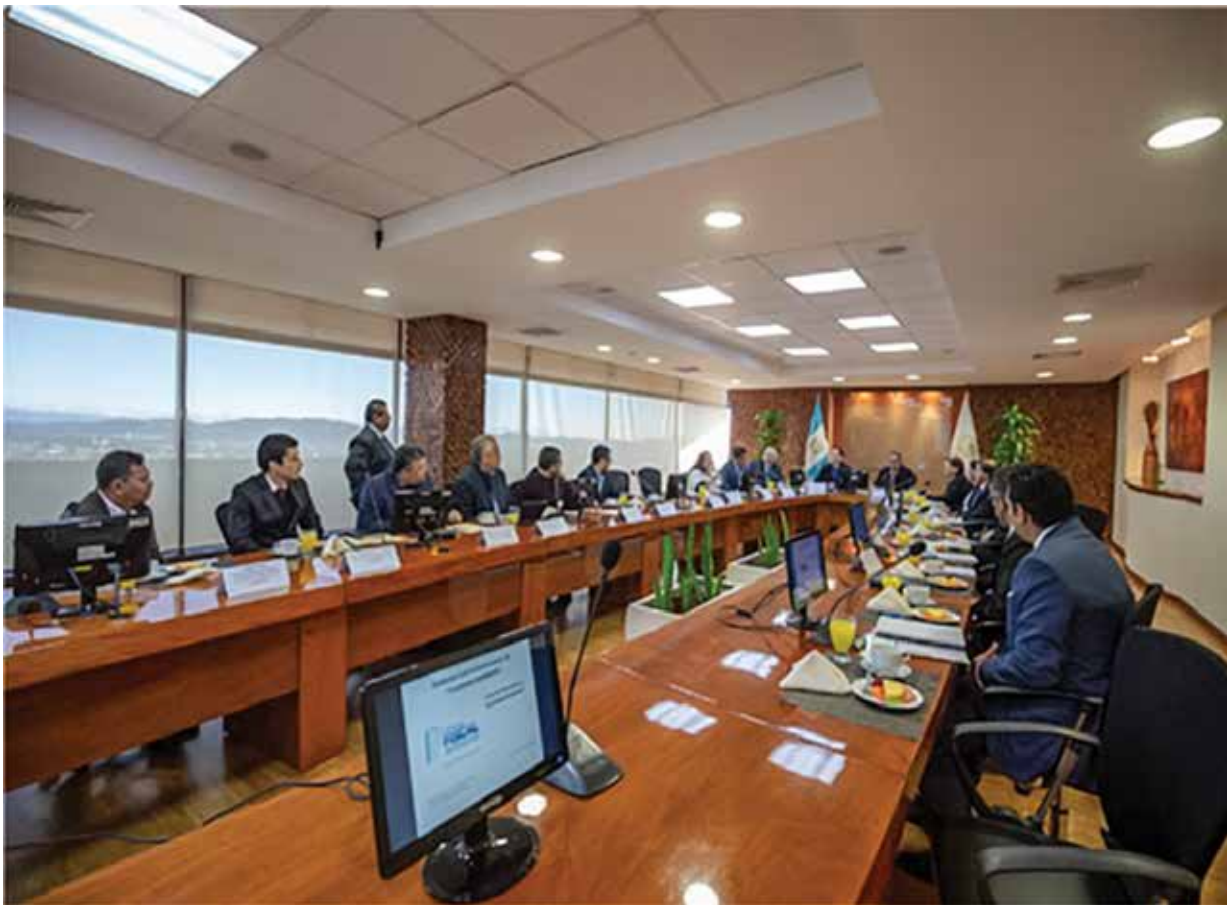
Reunión de socialización interna.

El MINFIN encamina esfuerzos por orientar la inversión pública y privada, al igual que el gasto presupuestario nacional para usar los recursos naturales y el potencial humano a favor del bienestar y del empleo de la población, así como para una distribución más equitativa de los recursos.