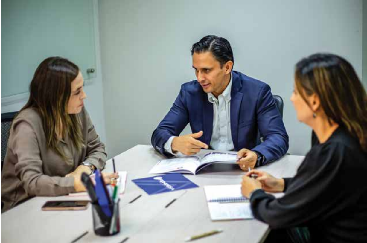
Reunión de trabajo con FUNDESA en el marco de la Mesa de Competitividad.

costera, es el punto intermedio de vínculo entre el principal puerto del país, Puerto Quetzal, y el corredor central del área metropolitana de Guatemala y hacia el sur. A través del Puerto Quetzal se realiza el 60% del comercio internacional, lo que ilustra la relevancia del corredor logístico y su importancia en la competitividad nacional. Sin embargo, la delincuencia, la falta de recursos públicos, la poca inversión en investigación e innovación y el poco ordenamiento territorial plantean desafíos al municipio y, en general, a la región portuaria.