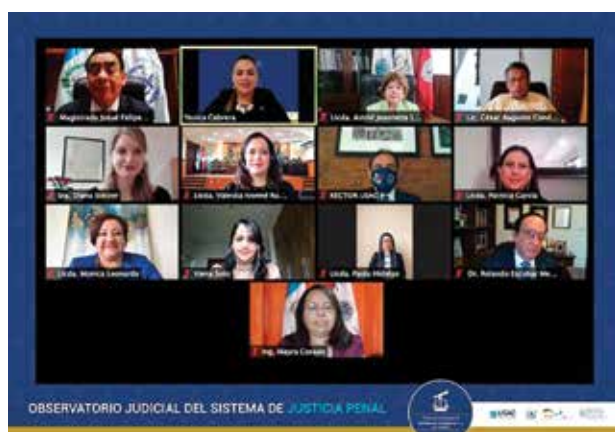
Evento de presentación del informe de la segunda cohorte.