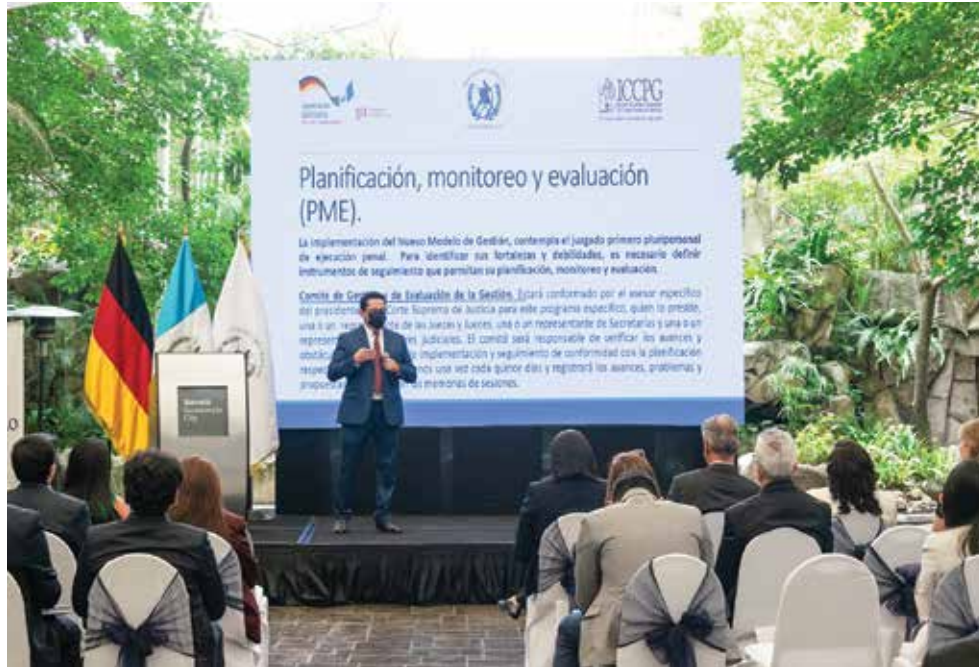
Evento de cierre del proyecto, mayo de 2022.