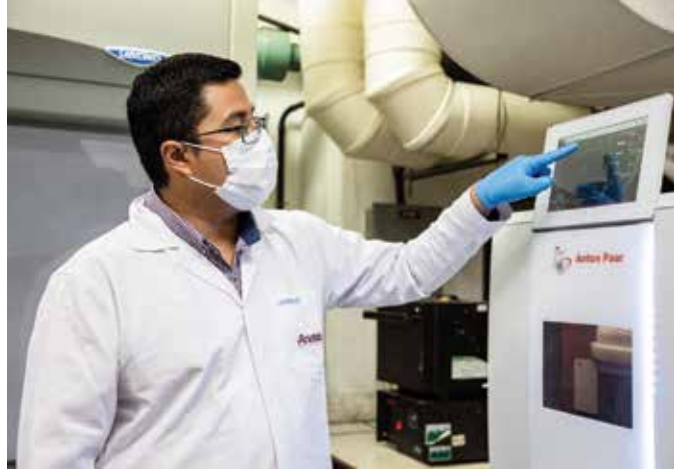
Laboratorio ANALAB.