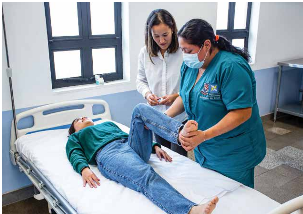
Alumna realiza ejercicio práctico en el Diplomado Asistentes en Salud.

El FRE acompaña a Junkacentro desde marzo de 2021 en la innovación e implementación de herramientas metodológicas y digitales para lograr esta reactivación económica de las mujeres guatemaltecas afectadas por la crisis postpandemia, especialmente de mujeres entre 16 y 45 años, que viven en áreas económicamente deprimidas y han sido afectadas por el COVID-19.