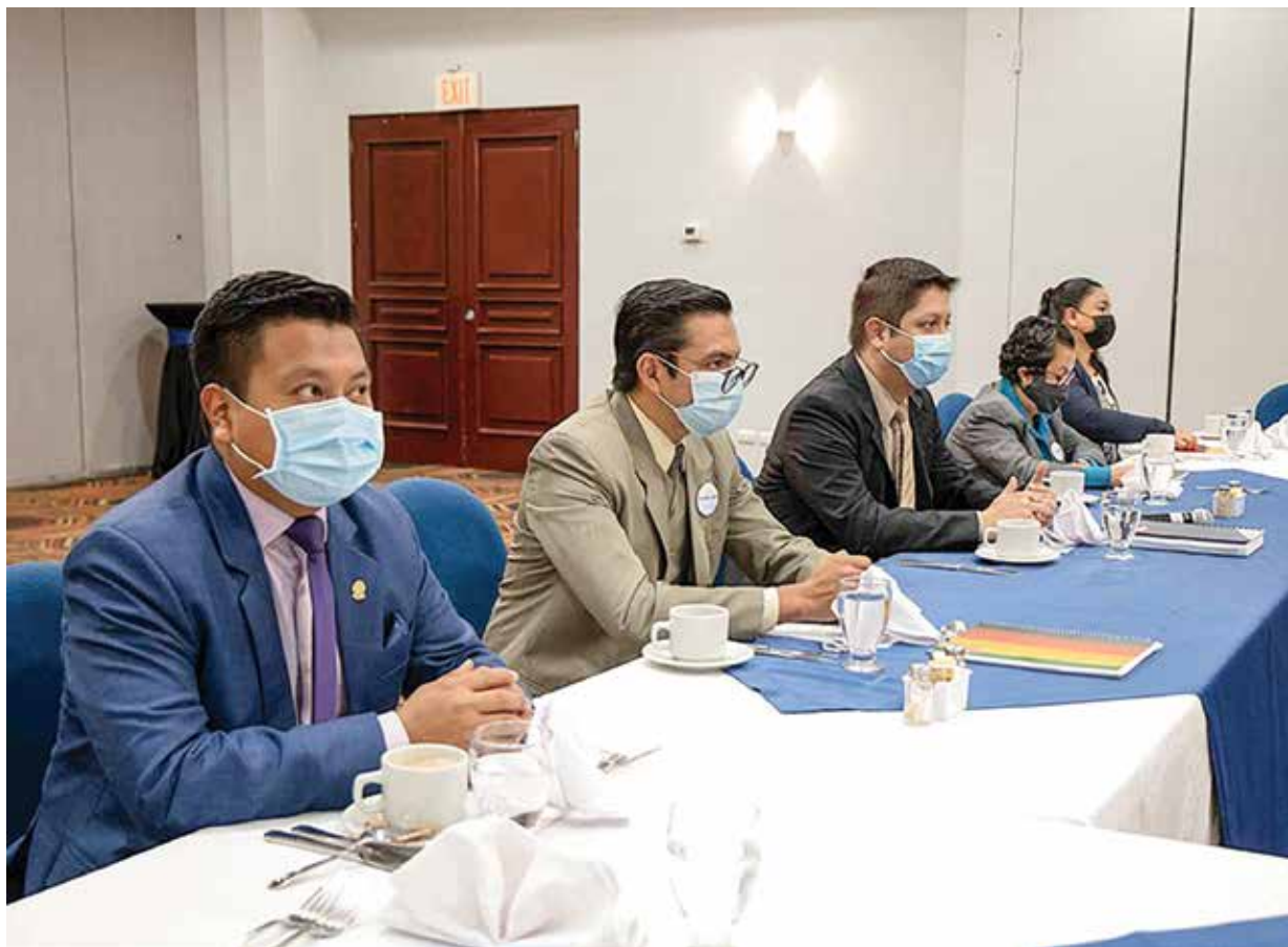
Junio 2021, COPADEH lleva a cabo la primera reunión del Foro Interinstitucional y presenta el SIMOREG.

En el marco del proyecto, se fortalecieron las capacidades de más de 100 funcionarios de COPREDEH y de los delegados del Foro Interinstitucional sobre los sistemas internacionales de protección de Derechos Humanos y sobre el uso del SIMOREG.